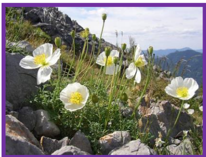
c) Mak tatranský