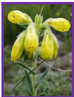
a) Rumenica turnianska