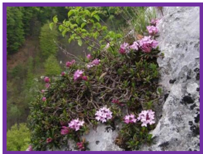
b) Lykovec muránsky