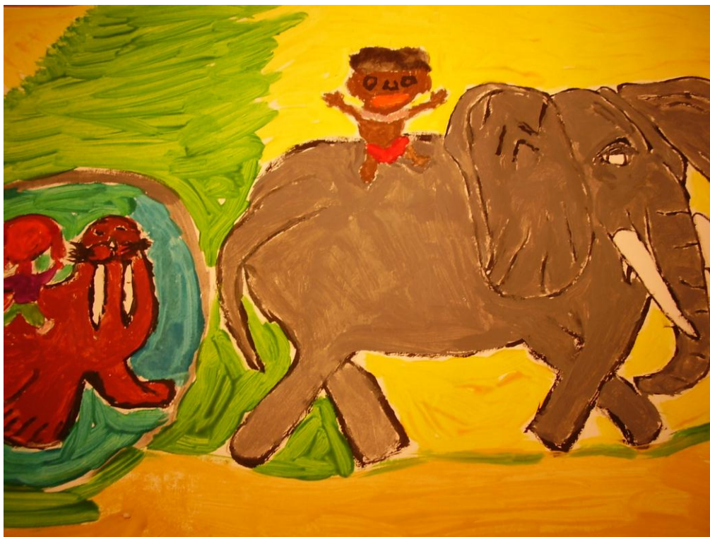
Viktória Plišková 4.A