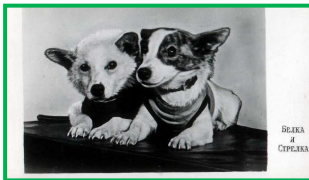
Belka a Strelka